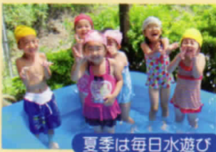
夏季は毎日水遊び