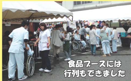
食品ブースには 行列もできました