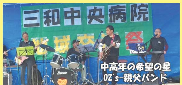
中高年の希望の星 OZ's 親父バンド