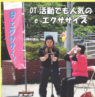
IT 活動でも人気の e-エクササイズ