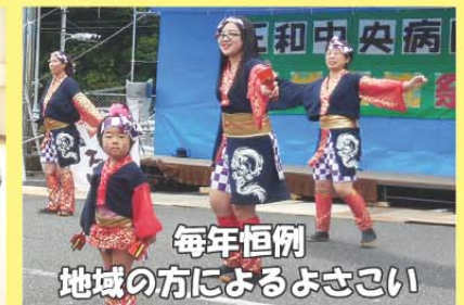
毎年恒例 地域の方によるよさこい