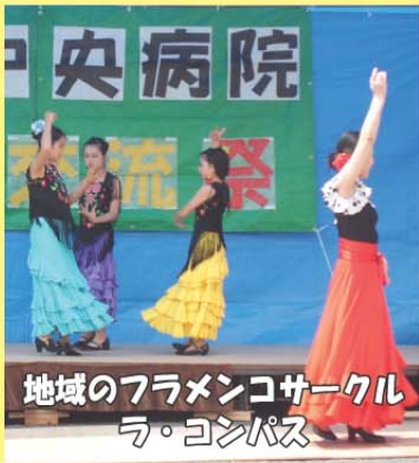
地域のフラメンコサークル ラ・コンパス

5/9に第1回目の地域交流祭りを開催致しました。患者様やご家族だけでなく、地域の方々にも気軽に来場していただきたいとの思いを込め“地域交流祭り”と名付けられました。午前中に降っていた雨も昼前にはあがり、名前のごとく、地域の方々の多数のご来場をいただき、みなさまの笑顔あふれる祭りとなりました。今後も、地域の方々との関わりを大切にした地域の病院として歩んでいきたいと思っております。