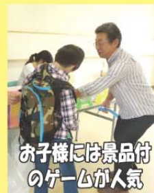
お子様には景品付 のゲームが人気