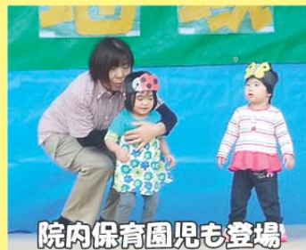
院内保育園児も登場