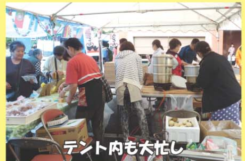
テント内も大忙し