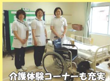
介護体験コーナーも充実