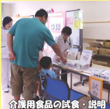
介護用食品の試食・説明